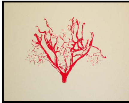
vasi sanguigni - coralli